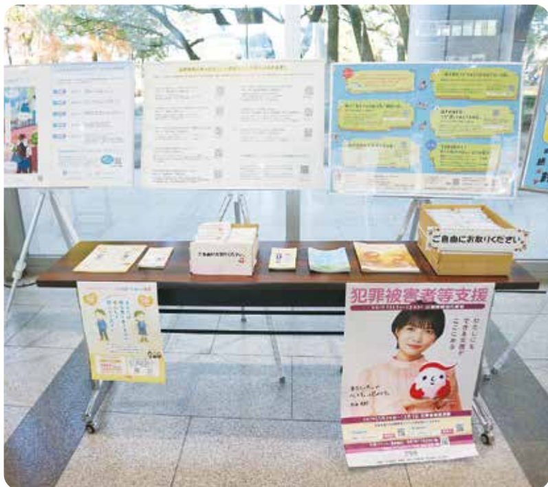
12月10日～23日 宮崎県立図書館展示