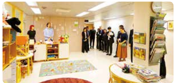
視察のようす(バルナフス)

今回の学びを通して、被害者が安心して支援につながるワンストップ体制や、関係機関とのより良い連携のあり方について、改めて考える機会となりました。今後の支援活動に少しずつ生かしていきたいと思えます。