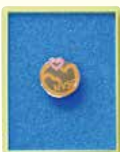
(正会員個人・賛助会員個人)